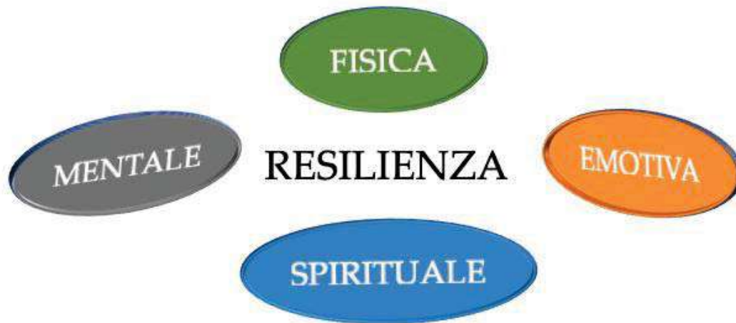
Figura 4: Le 4 dimensioni della Resilienza. In quella fisica fanno parte le sottodimensioni: riposo, fitness , nutrizione. In quella emotiva fanno parte le sottodimensioni: regolazione, ottimismo e controllo degli impulsi. In quella mentale fanno parte le sottodimensioni: prospettive, pensiero focalizzato, controllo di se stessi. Infine, in quella spirituale fanno parte le sottodimensioni: empatia, valori e credenze.

Il perseguire queste quattro dimensioni favorisce fenomeni di plasticità cerebrale adattiva 15 e, inoltre, rallenta l'invecchiamento cerebrale contrastando l'insorgenza di malattie neurodegenerative e di psicosi 16 .