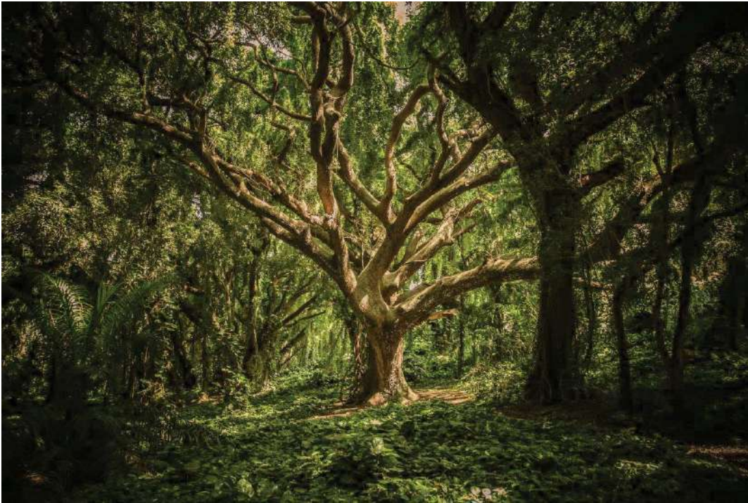
Fig. 1: Le radici dell'albero resistono a tutte le intemperie

Crederne fermamente in qualcosa produce a livello neuronale un fondamentale cambiamento che viene (in parte) spiegato da una interessante teoria, chiamata the embodiment of language 5 . Questa teoria nasce dall' humus culturale creatosi negli anni '90 grazie alla scoperta dei mirror neurons 6